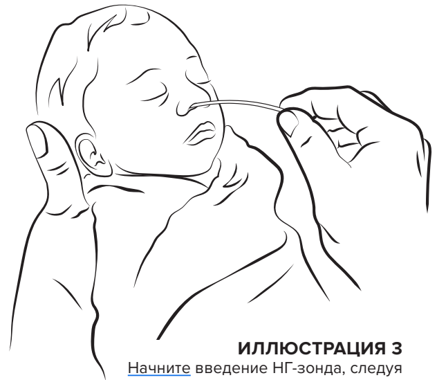
ИЛЛЮСТРАЦИЯ 3 Начните введение НГ-зонда, следуя естественному изгибу носового прохода ребёнка осторожным движением вперёд-назад.