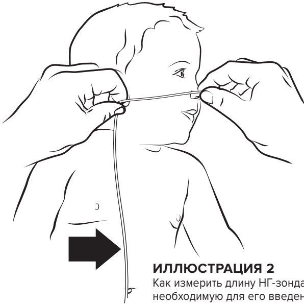
ИЛЛЮСТРАЦИЯ 2 Как измерить длину НГ-зонда, необходимую для его введения; стрелка указывает место, где необходимо поставить отметку.